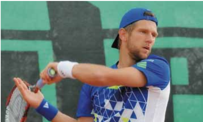
Punktete gegen Düsseldorf und Aachen für den Grün-Weiss: Jürgen Melzer